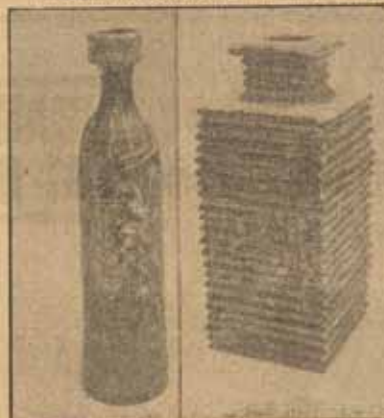
Cerámicas de «Vigreyos».

¿Agresividad plástica? Tiras y aflojas entre los campos informalistas y abstraccionistas? Simple. llanamente: «garra», palpitación de mundos sugestivos y sugeridores. ¿Que dónde lo encuadramos? El hecho de que «Vigreyos» vaya a figurar en el «Diccionario de Arte Abstracto» que dirige Fernando Zóbel, propulsor y director del museo de Cuenca, ya nos determina a intentar encasillarlo, pero... insistimos: «Vigreyos», se nos escapa, vuela alto como la fantasía de artista integral, de hombre inteligente y osado que es en este mundo