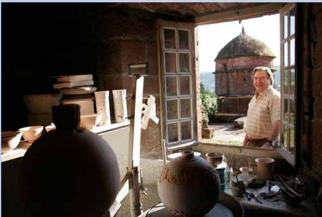
Vigeyos des de la finestra del seu estudi del château de La Coste, 2008. Foto: Conchín Juan. Vigeyos desde la ventana de su estudio del château de La Coste, 2008. Foto: Conchín Juan.