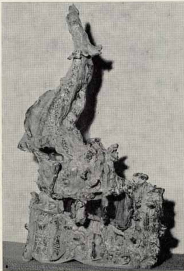
Un des sujets de VIGREYOS, équilibré, mystérieux, somptueusement émaillé.

ques. J'ai beaucoup été influencé par la religion. Si je n'avais été peintre, j'aurais été missionnaire. »