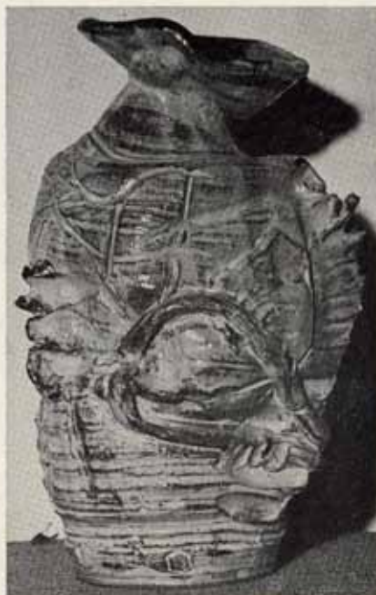
Un vase. Les doigts de l'artiste ont marqué la terre avant qu'elle ne soit cuite et émaillée.